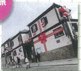
北野異人館町 クリスマスには、建物にかわいいサンタさんがいて楽しい☆彡