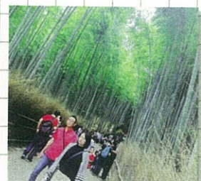
竹林 天気がいい日は、竹に光が当たってきれい!!