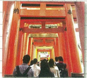
伏見稲荷大社 赤い鳥居がなんと1000本!!