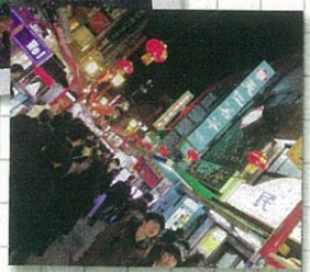
南京町 中華料理の美味しい食べ物がたくさん♡