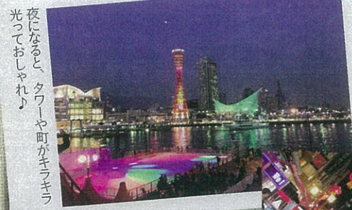
夜になると、タワーや町がキラキラ光っておしゃれ♪