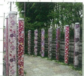
嵐山 水玉や花柄など、かわいい柄がたくさん♡