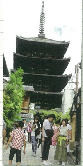
八坂の塔 せまい坂道を登ると…素敵な塔が見えてくるよ!